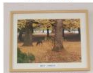
4F談話室に掛けている奈良公園の秋風景

写真をと、構の位置や池に写る風景を考えてシャッターを切る。なかなか楽しいものです。 下手な写真かも知れませんが私の好きな写真は、ダイフロアーにある黒猫のいる写真です。四国の金比羅さんで撮影しました。あわてて撮影しましたが位置もポーズも気に入っています。私がカメラを向けると付近の人も一斉にカメラを向けてきました。非常に楽しかったです。 次に好きな作品は四階の談話室にある奈良公園の秋の風景です。鹿とイチヨウの葉の色と調和して好きな一枚となっています。その他同好会の皆さんの写真もたくさん見て頂きます。ありがとうございます。