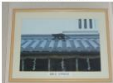
ダイフロアーに掛けている「黒猫」のいる写真

写真は小学校六年の時、小さい玩具のようなカメラで始めた。東尋坊の写真がよく撮れた一枚だった。間もなく戦争となり、それどころではなかったが、病院勤務中「シラスギ」の写真を得意とするプロにある程度のことを教えてもらったが、なかなか難しい。写真の勉強会では「この写真は何を撮ったんや。あれもこれも欲どうしく撮ってポイントがない」とか、なかなかむづかしい。それでも少しは芸術的な写真が、二枚出来あがった。 アップルではご利用の皆様楽しんで頂ける写真を目指し、奈良を中心に撮影しています。現在では同好会も発足しています。 あちこち歩いて健康にもよく、風景写真でもそこでも満足のようない