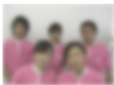
【パワーリハビリテーション】 健康運動実践指導者スタッフ

かストレッチ体操をされる機会にはほとんどないと思われる中で、自宅でも簡単にしているだけを紹介しております。今年新しく東海道五十三次を歩く目標を設定し、利用時に付けて頂いている万歩計から、一ヶ月毎のトータルを出し、どの辺りを歩いているか?ご自身の活動量の目安として、また自信をもって日常生活へ反映して頂くようと考えて提案・実行させて頂いていただいております。一層のサービス向上に努めてまいりますので、今後ともよろしくお願い致します。