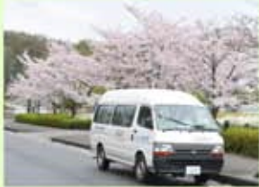
↑ お花見ドライブの様子

平成二十七年四月五日(日) 入所施設行事「お花見ドライブ」を開催しました。当日は曇り時々雨というあいにくの天気。当初は、けいはんな記念公園でお花見遠足の予定でしたが、