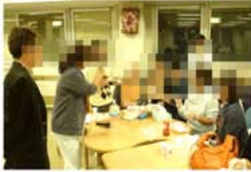
↑ 清掃方法を説明する歯科衛生士さん