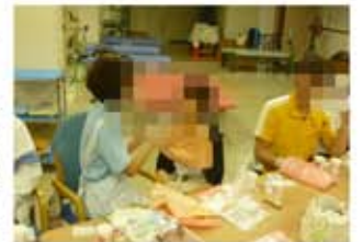
↑ お互いに口腔ケアをする職員

具体的なお口清掃方法と留意点を学び、そのあと二人ペアーに分かれて、職員同士で口腔ケアを体験しました。清掃セットが用意され、各自が手袋をはめて、相手の舌をつかんで口腔ケアを行いました。