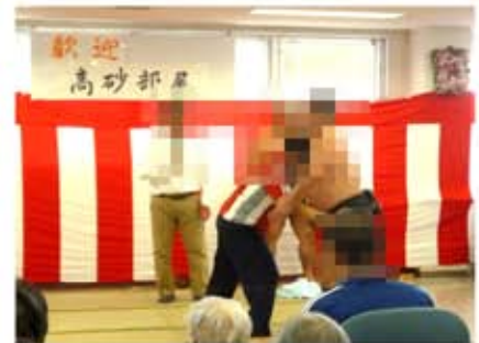
↑力士に挑戦するパワーリハビリテーション職員